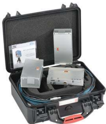
Прочный и удобный кейс для надежного хранения аксессуаров

Каждый лазерный сканер компании Z+F поставляется с комплектом дополнительных принадлежностей, который включает: