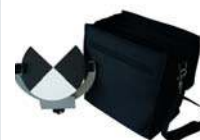
Сумка для хранения и переноски марок (помещается 6 проф. марок)