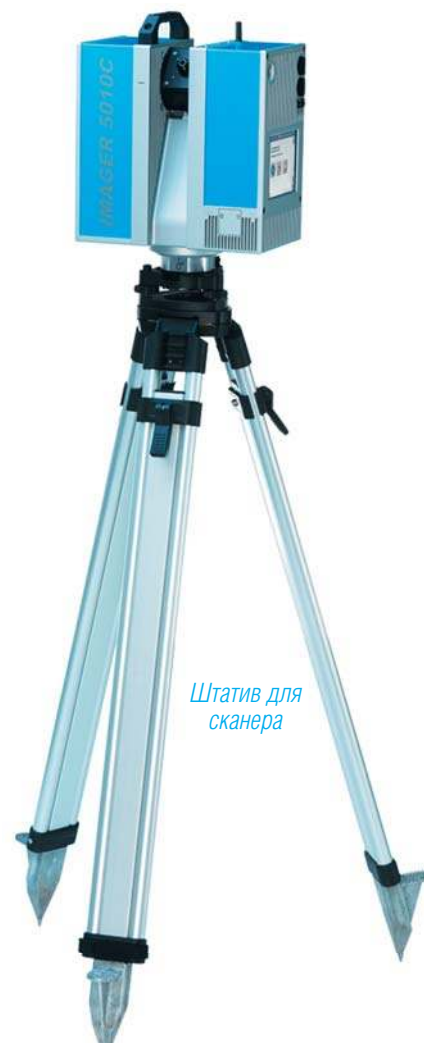
Штатив для сканера